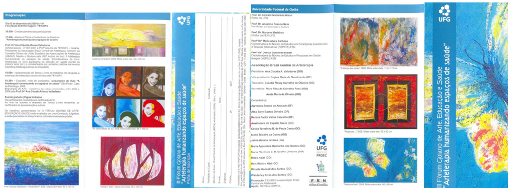
Fig. 5 – Catálogo de Arte da "Arteterapia humanizando espaços de saúde" da exposição de Arte individual regional, lançado durante o III Fórum Goiano de Arte, Educação e Saúde em 2008