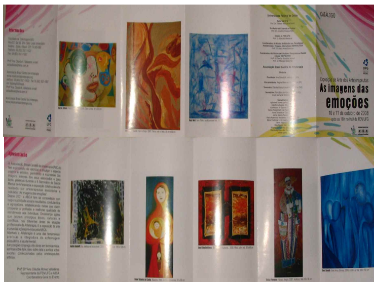
Fig. 2 – Catálogo de Arte "As imagens das emoções" da exposição Coletiva Regional de Arte, publicado durante o II Seminário de Saúde Mental e Arteterapia em 2008