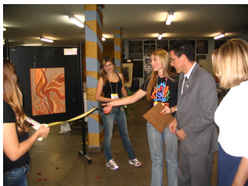
Fig. 3 – Foto da Inauguração da Exposição Coletiva Regional de Arte "As imagens das emoções" durante II Seminário de Saúde Mental e Arteterapia em 2008

Oito artistas e arteterapeutas vinculados à Associação Brasil Central de Arteterapia participaram do Catálogo de Arte "A imagem das emoções", com as obras descritas abaixo: