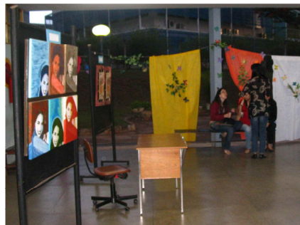
Fig. 6 – Foto da Exposição Individual Regional de Arte "Arteterapia humanizando espaços de saúde" durante o III Fórum Goiano de Arte, Educação e Saúde em 2008

Uma artista e arteterapeuta vinculada à Associação Brasil Central de Arteterapia participou do Catálogo de Arte "Arteterapia humanizando espaços de saúde", com as sete obras listadas abaixo: