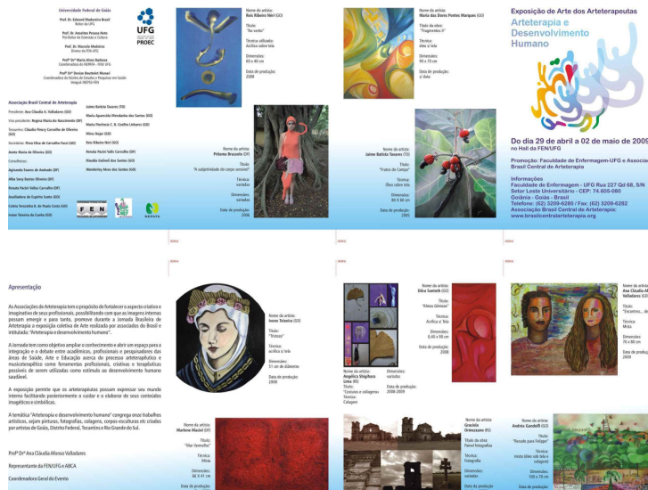
Fig. 8 – Catálogo de Arte da "Arteterapia, Musicoterapia e desenvolvimento humano" da exposição de Arte Coletiva Nacional, inaugurado durante a I Jornada Brasileira de Arteterapia, IX Fórum Brasileiro de Arteterapia e IV Fórum Goiano de Arteterapia em 2009