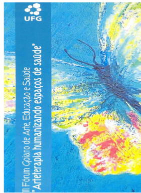
Fig. 4 – Capa do Catálogo de Arte da "Arteterapia humanizando espaços de saúde" da exposição de Arte individual regional, lançado durante o III Fórum Goiano de Arte, Educação e Saúde em 2008