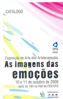
Fig. 1 – Capa do Catálogo de Arte "As imagens das emoções" da exposição Coletiva Regional de Arte, publicado durante o II Seminário de Saúde Mental e Arteterapia em 2008

Palabras-clave: Arteterapia; Catálogos de arte; Asociación